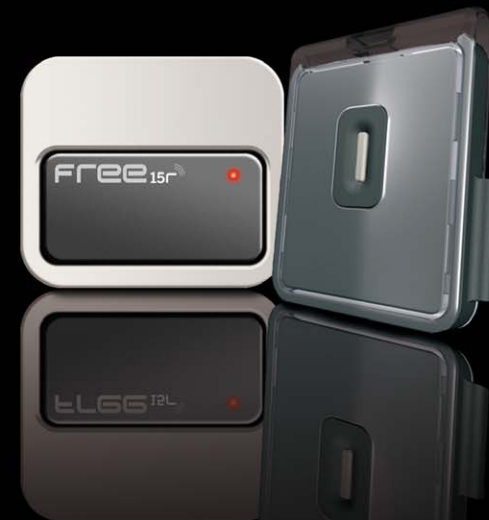
sistema a mani libere per veicoli e persone