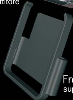
FreeT supporto per auto