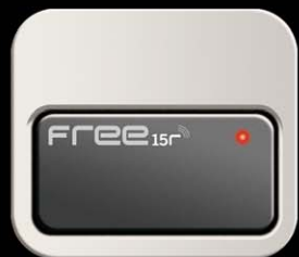
Free15r Attivatore del Tag